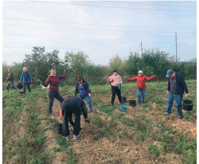
La récolte commune de pommes de terre donne aux réfugiés un peu d'autonomie.

L'intervention de Longo maï m'a soulagée au début de l'agression russe. Grâce aux encouragements d'amis partageant les mêmes idées nous avons essayé de créer, pour les gens touchés par la guerre, une «normalité» dans monde devenu fou.»