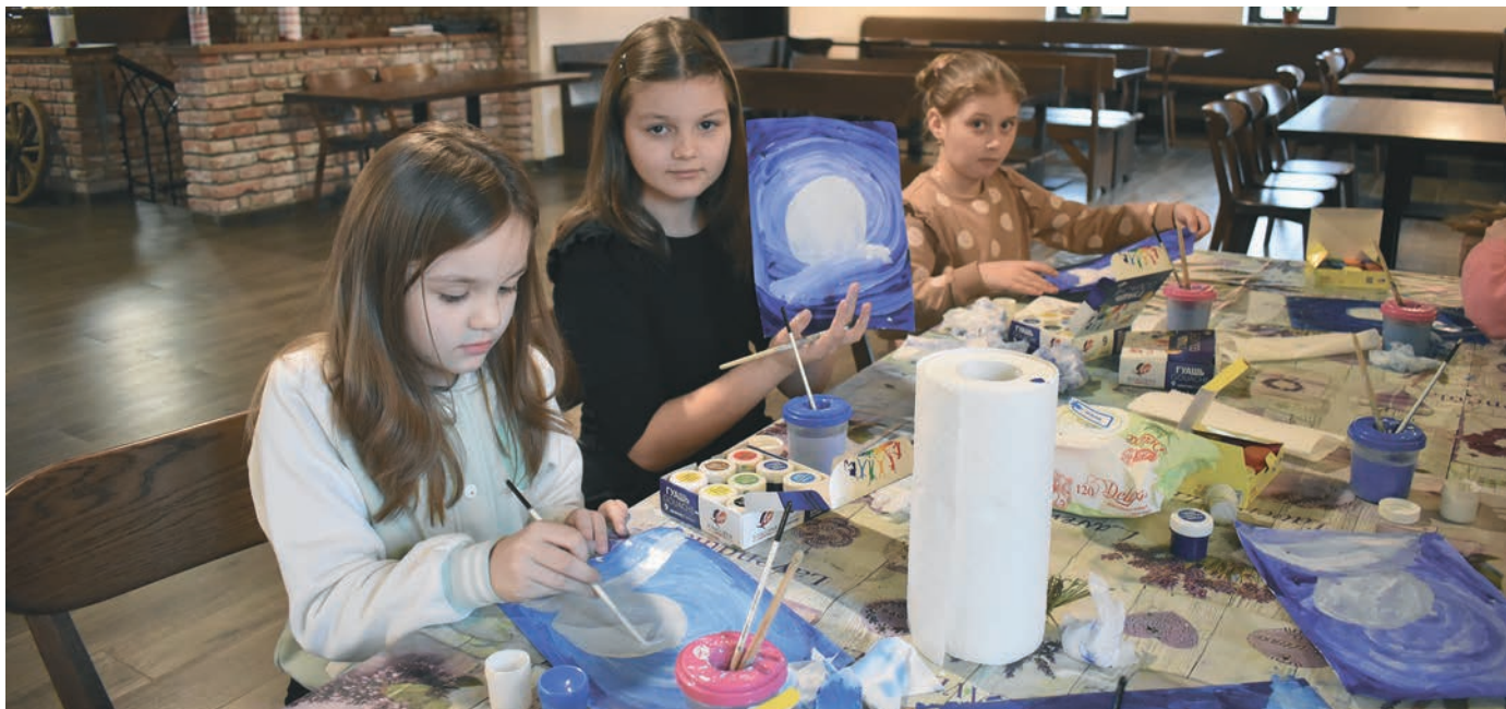
Grâce au dessin et l'art-thérapie, les enfants redonnent des couleurs à leur passé sombre.