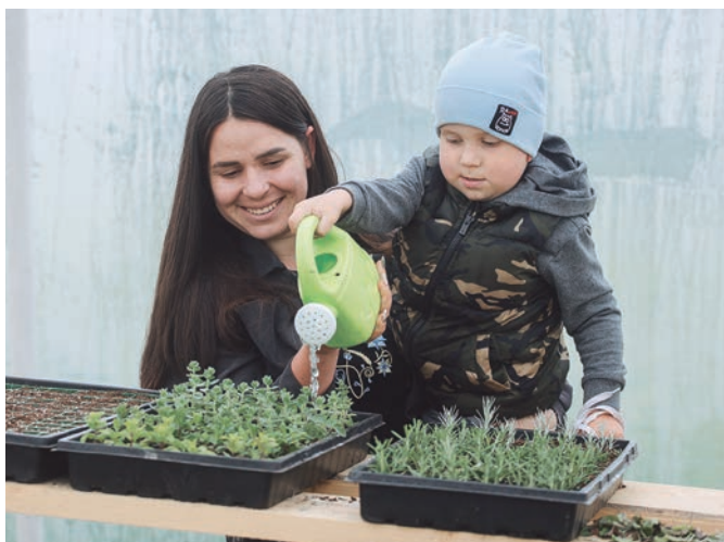
L'arrosage des plantes médicinales est un baume pour l'âme.