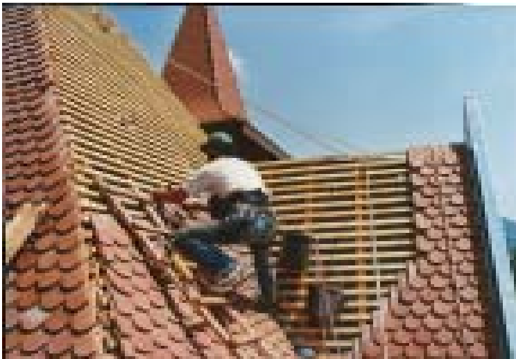
La construction et la pose de la charpente permettent l'autonomie financière de la coopérative

l'élagage, le débardage à cheval et le câblage. Des stages de formation auront lieu dès que possible à Treynas. De plus, les habitants de Treynas ont démarré depuis quelques mois un projet d'entraide avec une communauté rurale de soixante-dix personnes au Mexique. Cette communauté a pour projet de développer tout un travail autour de la filière bois, de l'entretien de la forêt jusqu'aux métiers du bois. C'est à Longo maï qu'ils ont demandé conseils et formation. D'autres contacts sont en cours avec une communauté de Navarre pour les mêmes buts.