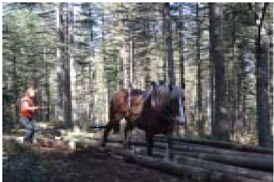
L'utilisation de la force du cheval, un apprentissage exigeant

Depuis le début des années 2000, toutes les fermes de Longo maï sont propriétés de la fondation suisse Fonds de terre européen. De ce fait, nos fermes et nos terres sont définitivement hors d'atteinte de la spéculation ou querelle d'héritage. La fondation est propriétaire, les occupants des fermes jouissent d'un droit d'usage inaliénable, à condition de respecter les objectifs écologiques et solidaires de Longo maï. Le conseil de la fondation est composé de membres de toutes les fermes de Longo maï. C'est une véritable propriété collective, une sorte de communal à l'échelle européenne. La nouvelle forêt de la Grangette fera partie de ce communal. Cet achat fait partie d'un ensemble d'investissements indispensables pour préparer l'avenir, transmettre nos savoirs et réalisations. Longo maï aura bientôt 40 ans et plus que jamais nous devons continuer de construire, d'augmenter nos capacités d'accueil et de formation, de permettre aux plus jeunes de choisir leur chemin, de fonder leur avenir; de permettre aux plus anciens de se reposer là où ils veulent dans le communal en léguant leurs savoirs multiples. Participez avec nous à ce grand dessein, nous nous efforcerons ensemble d'encourager des initiatives vouées à revivifier les zones montagneuses ou périphériques de l'Europe, en dehors des soubresauts de la bourse et des aléas d'une