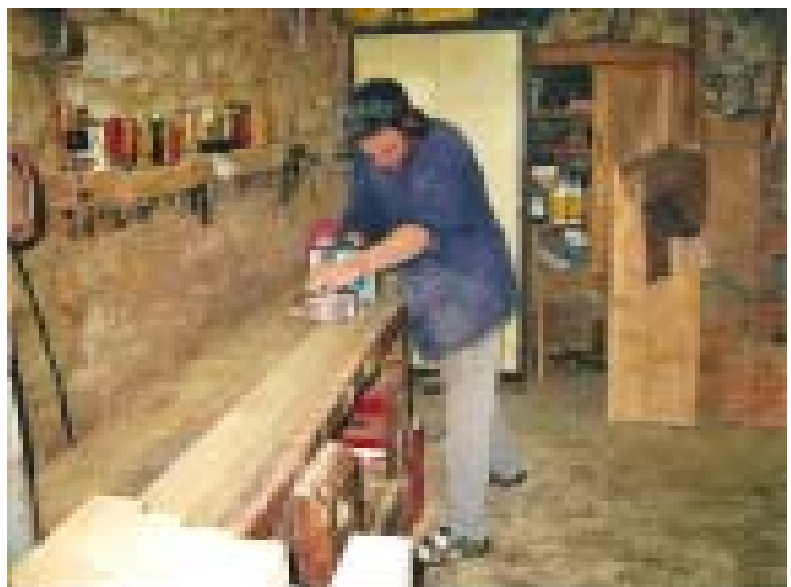
L'équipe de menuiserie a été formée dans le Jura suisse

Notre idée avec cette nouvelle forêt, la forêt de la Grangette, outre le fait de la protéger d'un massacre total, c'est d'en faire une forêt école. Un lieu école et expérimental sur l'écologie, la gestion forestière et la transformation du bois. C'est pour cela que nous avons besoin d'un massif forestier plus important que nous voulons progressivement transformer en forêt jardinée et y développer des activités de formation telles que l'abattage sélectif,