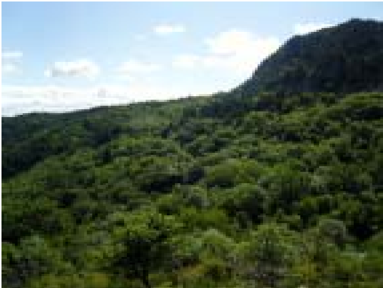
Vue sur la forêt de la Grangette en Ardèche dans le Massif Central français, menacée de coupe rase.

«La nature est un temple où de vivants piliers laissent parfois sortir de confuses paroles ...» écrivait le poète Charles Baudelaire, le message du vent à travers les arbres de la forêt.