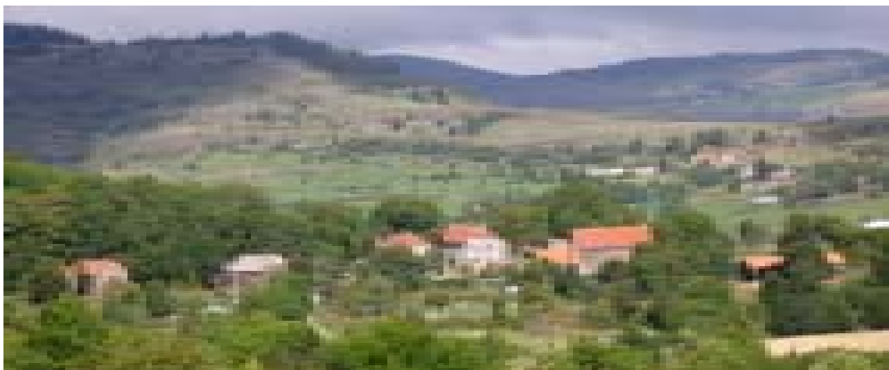
La ferme de Longo maï à Treynas

Accueil et formation de jeunes, achat de terres contre la spéculation foncière, entraide régionale, lutte contre l'exode rural, maintien de la diversité du vivant.